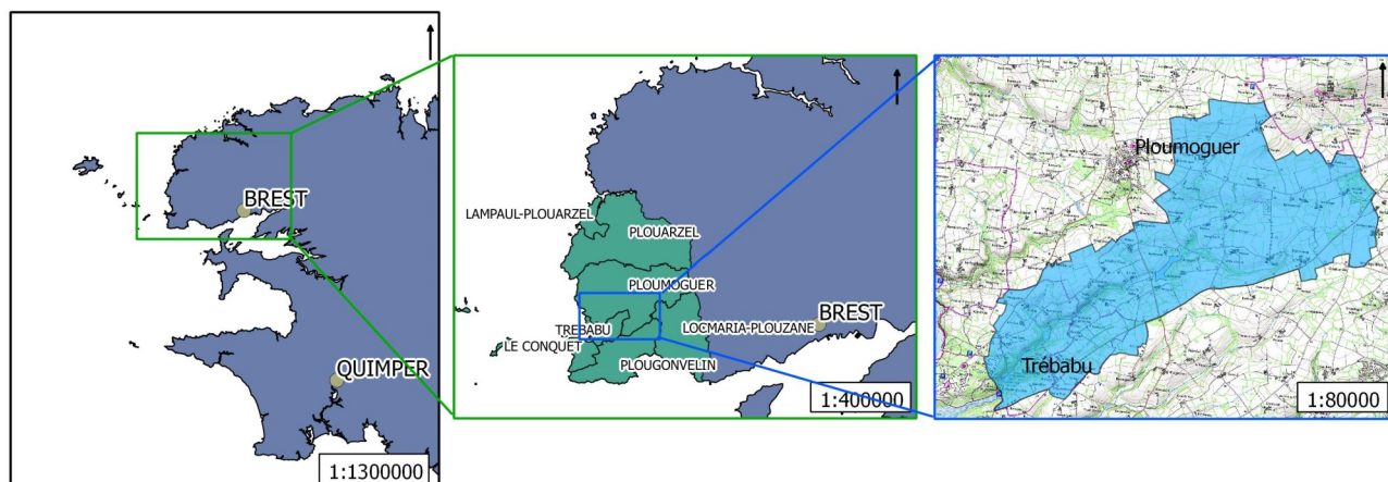
Figure 1 : Situation et emprise territoriale du bassin versant de Kermorvan

Le bassin versant de Kermorvan se situe dans le quart nord-ouest du département du Finistère. C'est un bassin versant côtier, et le plus petit bassin versant en gestion par contrat territorial de Bretagne. D'une superficie de 1415 ha, il s'étend sur quatre communes dont deux principales : Ploumoguier (77% de la superficie du bassin), Trébabu (18%), et deux communes secondaires : Loc Maria-Plouzané (4%) et Le Conquet (1%). Aucune des communes n'est donc totalement concernée par le territoire du bassin versant.