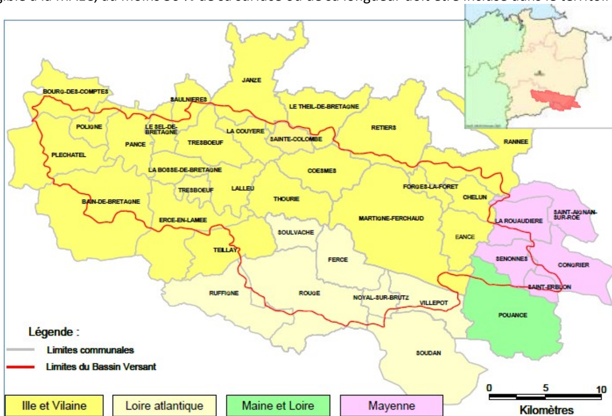
Carte de localisation du Bassin du Semnon

En ce qui concerne les mesures « localisées », pour qu'une parcelle ou un élément linéaire soit éligible à la MAEC, au moins 50 % de sa surface ou de sa longueur doit être incluse dans le territoire.