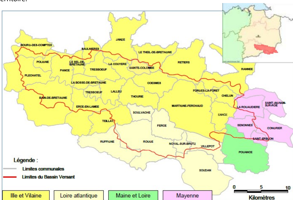
Carte de localisation du Bassin du Semnon

En ce qui concerne les mesures « localisées », pour qu'une parcelle ou un élément linéaire soit éligible à la MAEC, au moins 50 % de sa surface ou de sa longueur doit être incluse dans le territoire.