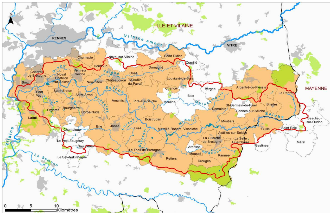
Les communes adhérentes au Syndicat Intercommunal du Bassin Versant de la Seiche

— Périmètre du bassin-versant de la Seiche Communes adhérentes au Syndicat Intercommunal du bassin-versant de la Seiche