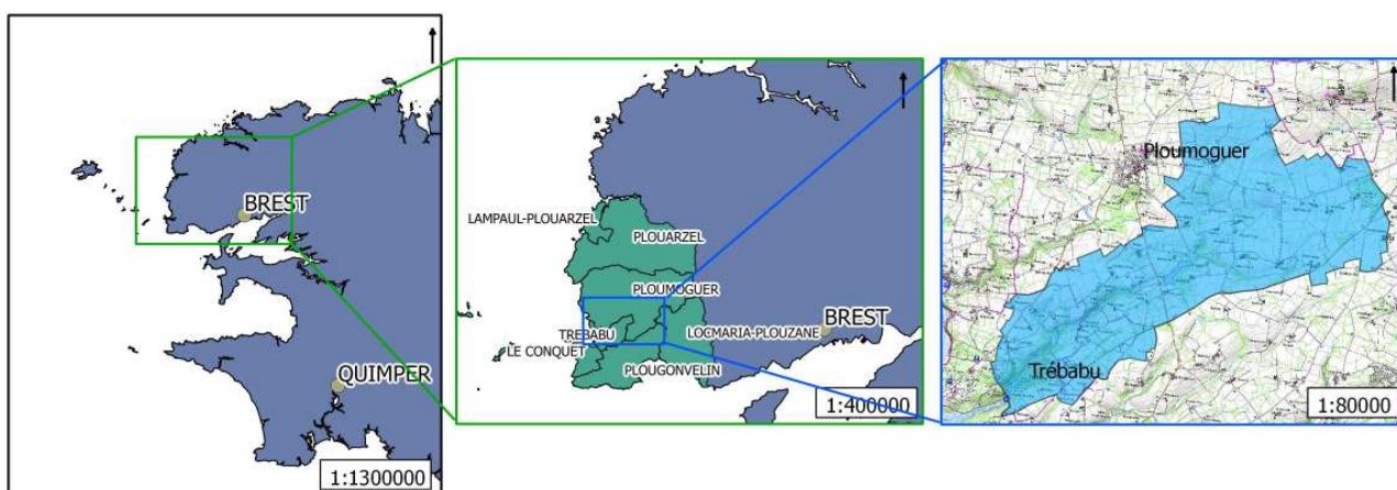
Figure 1 : Situation et emprise territoriale du bassin versant de Kermorvan

Le bassin versant de Kermorvan se situe dans le quart nord-ouest du département du Finistère. C'est un bassin versant côtier, et le plus petit bassin versant en gestion par contrat territorial de Bretagne. D'une superficie de 1415 ha, il s'étend sur quatre communes dont deux principales : Ploumoguier (77% de la superficie du bassin), Trébabu (18%), et deux communes secondaires : Loc Maria-Plouzané (4%) et Le Conquet (1%). Aucune des communes n'est donc totalement concernée par le territoire du bassin versant.